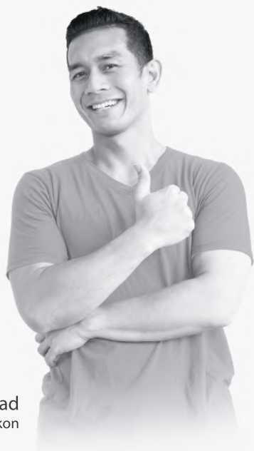
Fahrin Ahmad Pelakon